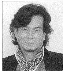
テノール：錦織 健