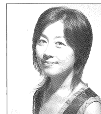
パイプオルガン：長井浩美

東京藝術大学作曲科および指揮科を卒業。第1回ブダペスト国際指揮者コンクール第1位、特別賞受賞。世界中の数々の音楽祭出演や欧州のオーケストラを多数指揮。ハンガリー国立交響楽団音楽総監督、日本フィルハーモニー音楽監督、アーネム・フィルハーモニー常任指揮者など国内外で数々のオーケストラのポジションを歴任。ハンガリー政府よりリスト記念勲章、ハンガリー文化勲章、民間人最高位の「星付十字勲章」ハンガリー文化大使の称号が授与されている。2011年文化庁長官表彰を受ける。1999年には管弦楽曲「パッサカリア」を作曲。同年オランダで初演され大好評を博した。2002年にはプラハの春音楽祭オープニングコンサートを東洋人として初めて振るなど、最も活躍し注目されている指揮者。現在、ハンガリー国立フィル、日本フィルおよび名古屋フィルの桂冠指揮者、読売日響の特別客演指揮者、九響の首席客演指揮者、東京藝術大学、東京音楽大学およびリスト音楽院名誉教授などを務める。2012年7月より東京文化会館音楽監督に就任。2013年秋の叙勲で、これまでの功績により旭日中綬章が授与された。