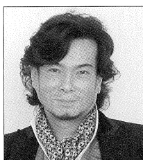
テノール：錦織 健