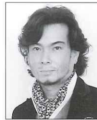
テノール:錦織 健