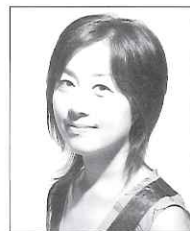
パイプオルガン:長井浩美