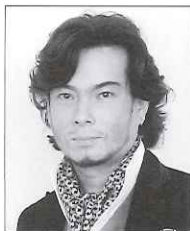
テノール:錦織 健