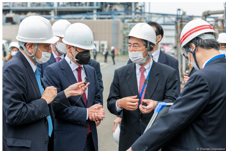
井内常務執行役員(左)、榊田会長兼社長(右)より説明を受けるショルツ首相(左から二番目)