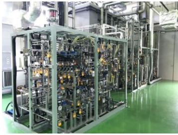
図1：千代田化工建設子安リサーチパーク内パイロットプラント