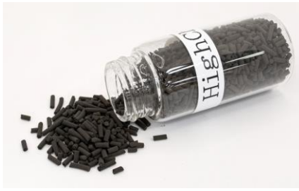
図2：ハイケム工業触媒